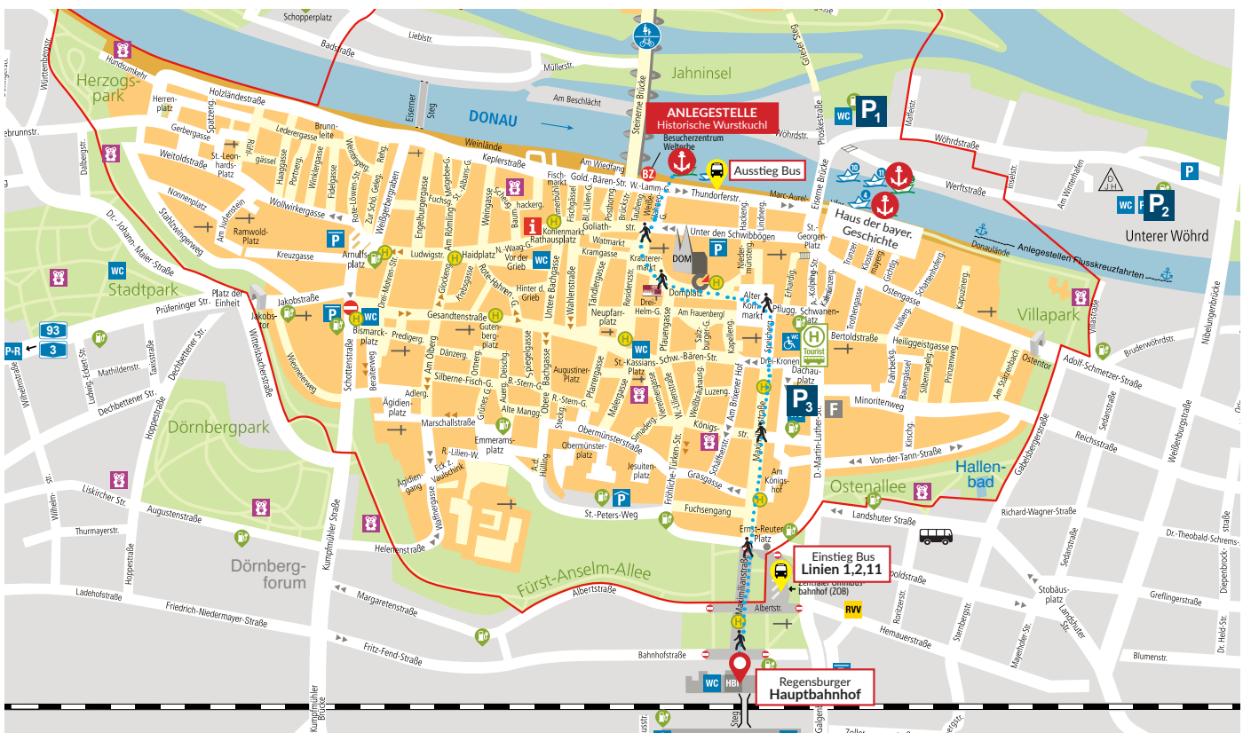
Karte: Regensburg Tourismus GmbH

https://www.einkaufen-regensburg.de/service/parken-amp-anfahrt.html